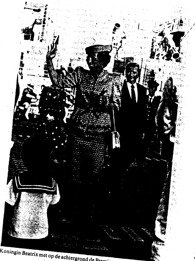
• Koningin Beatrix met op de achtergrond de Premier van N.S.W. Nick Greiner.

Aankomst om 6 uur, prachtige blauwe lucht, Opera Huus op de achtergrond want de grote "Witte de With" binnen met koningin