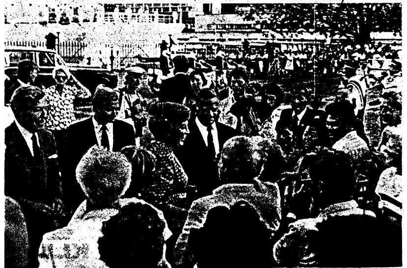
• Na de officiële ontvangst was er even tijd voor een praatje.

↑ Ze was bijna bij ons toen drie Japanners ertussen vloegen en al guchelend foto's maakten. Beatrix deed een stap terug en draaide zich om.