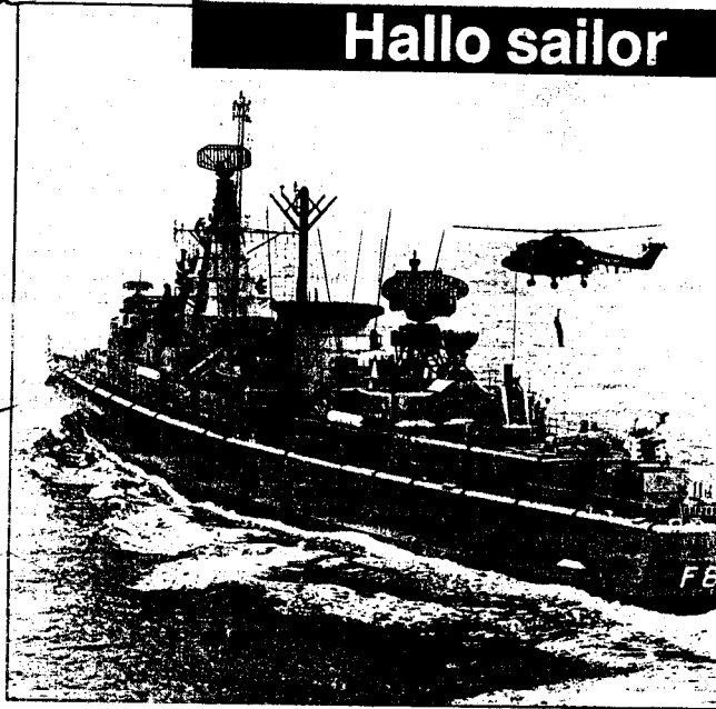
GROETEN UIT NEDERLAND VOOR DE "DUTCHIES"