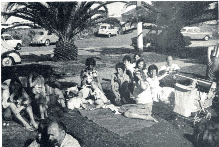
IN AFWACHTING VOOR HEN, DIE NOG STEEDS NIET GEARRIVEERD ZIJN.