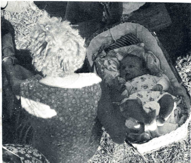
LUNCH VOOR DE JONGSTE RALLY-IST !!

Het traject in de middag, hoewel op het oog gezien eenvoudig, heeft diverse deelnemers die nog vol goede moed waren, tegen 4 uur de strijd doen opgeven, daar ze hopeloos verdwaald waren. Het was uiterst jammer dat er geen verzegelde enveloppe verstrekt was aan de deelnemers om hen althans naar het eindpunt te doen komen. Dit heeft die slachtoffers meer ontmoedigd dan het feit dat ze het eindpunt zelf niet hebben kunnen vinden. Enfin, een volledig verslag van de rally wordt in dit blad bijgesloten. Onze Troebeloeris heeft het aan het rechte eind: "volg een car met een goede navigator!" Iets om voor een volgende keer in gedachten te houden.