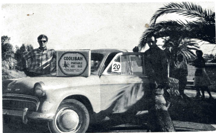
DE WINNAARS D.C.S.S.-AUTO-RALLY '66