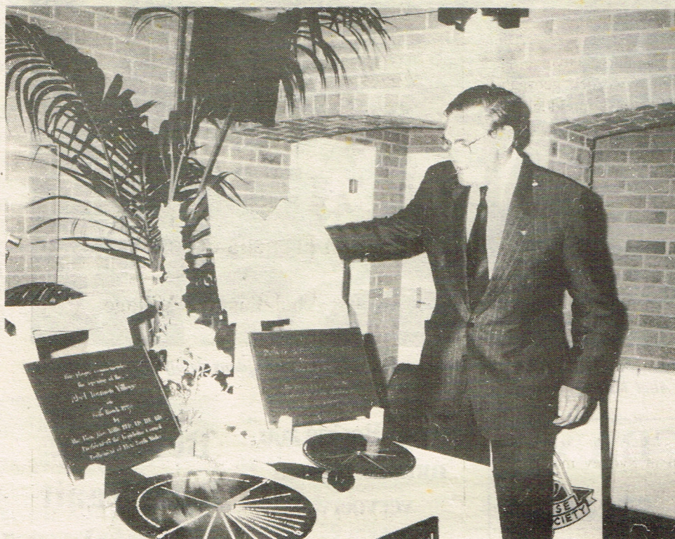
* Ambassadeur Bast onthult de plaquette van het Dutch Australian Centre.