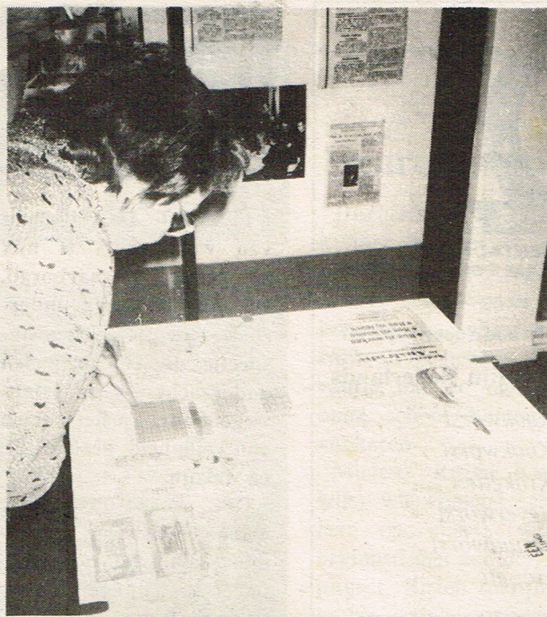
* Veel te zien in het Dutch Australian Centre.

from all of us at the ABEL TASMAN VILLAGE