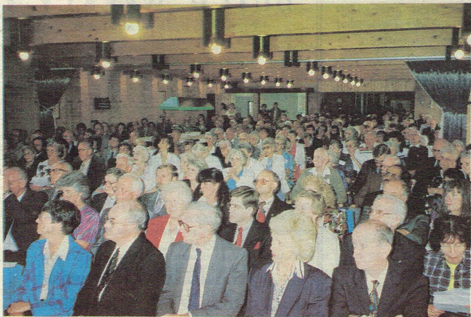
* Veel publieke belangstelling tijdens de opening van het dorp.